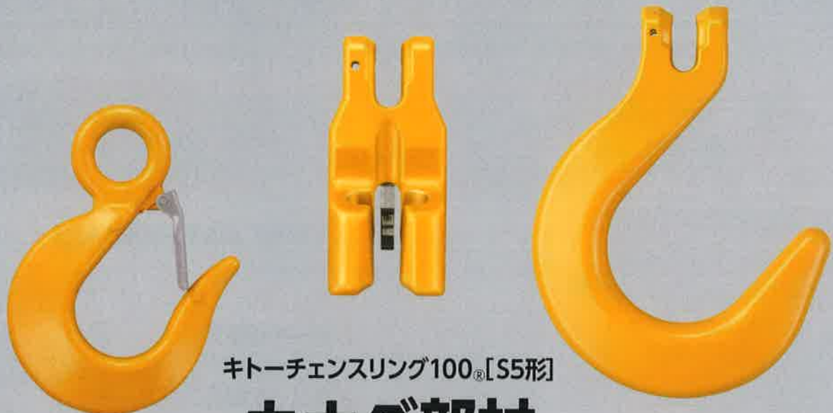
キトーチェンスリング100 ® [S5形]